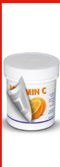
Etiquetado en origen