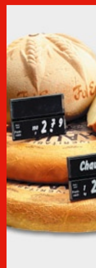
Soluciones de Merchandising

LAFORJA INTERNACIONAL, S.A. Muntaner 479-08021 Barcelona Teléfono: 93 4186868 E-mail: retail@laforja.com